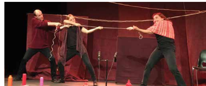
05/10/2016 - Besançon, une réflexion initiée à partir d'un théâtre-forum