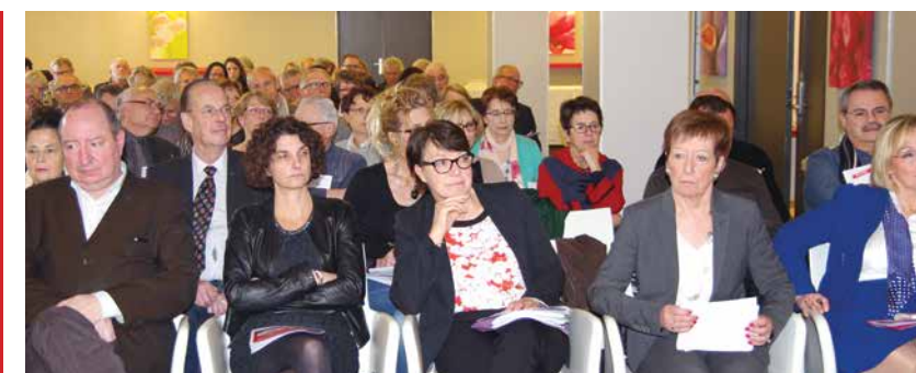
Dès avril 2016, animation en commun de la vie militante : 8 rencontres sur le vieillissement organisées sur chaque département par les deux Unions régionales

Au final, un objectif clairement défini : être un acteur reconnu de santé publique, de l'économie sociale et solidaire et local autour de nos implantations.