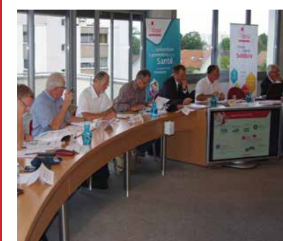
Besançon, 26/09/2016 : séminaire d'accueil des administrateurs