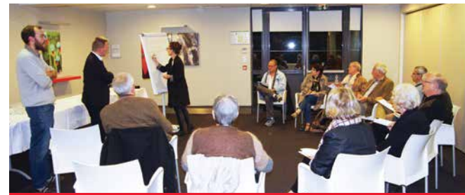
13/10/2016 - Dijon, atelier de contribution.

Sept espaces de discussions sur la santé environnementale ont été organisés en octobre 2016. Avec l'appui d'experts de la thématique, ils ont concilié débats d'idées et construction de propositions concrètes autour d'axes stratégiques : l'eau, la qualité de l'air intérieur, la pollution atmosphérique, les perturbateurs endocriniens ou le bruit.