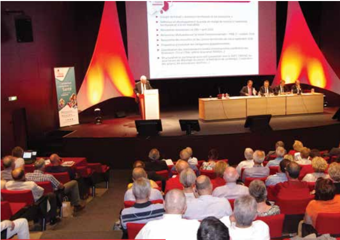
01/07/2016 - BEAUNE - Palais des Congrès Naissance de la Mutualité Française Bourgogne-Franche-Comté, fruit de la fusion des Unions régionales de Bourgogne et de Franche-Comté, à l'issue de trois Assemblées générales (des deux anciennes Unions puis de la nouvelle).