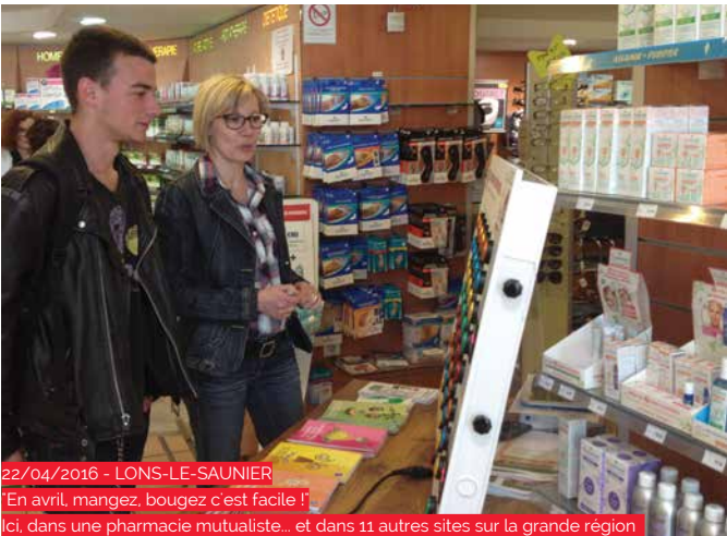
22/04/2016 - LONS-LE-SAUNIER "En avril, mangez, bougez c'est facile !" Ici, dans une pharmacie mutualiste... et dans 11 autres sites sur la grande région