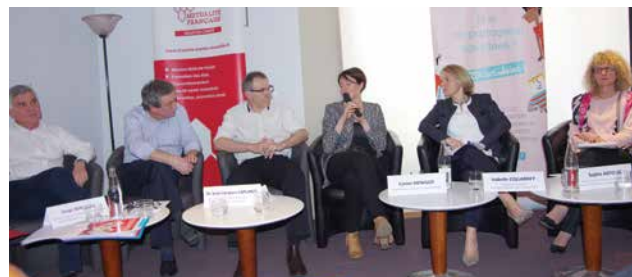
05/04/2016 - Frotey-lès-Vesoul