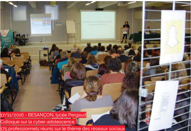
17/11/2016 - BESANÇON, lycée Pergaud Colloque sur la cyber-adolescence. 175 professionnels réunis sur le thème des réseaux sociaux