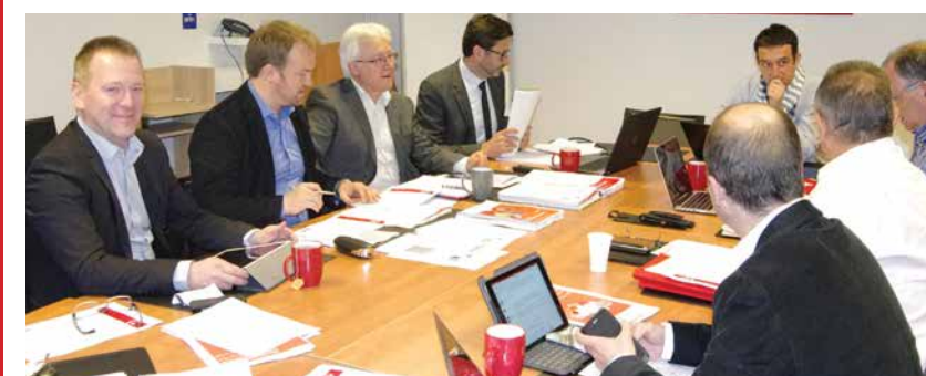
Instances, comités de pilotage fusion, groupes de travail "Communication" et "Vie du mouvement" : élus et direction mobilisés