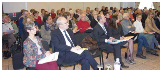
26/04/2016 - Auxerre