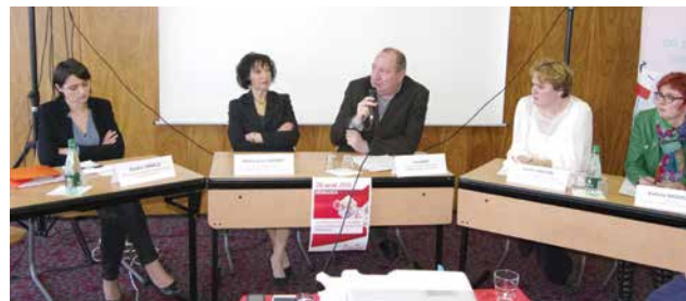
05/04/2016 - Danjoutin

Elles ont réuni 500 militants et élus mutualistes, mais également 36 intervenants représentant les conseils départementaux, l'ARS, les caisses de retraite inter-régimes, les Services de Soins et d'Accompagnement Mutualistes (SSAM), les mutuelles santé et différentes associations qui ont pu croiser leur point de vue sur la réforme impulsée par la loi du 28 décembre 2015.