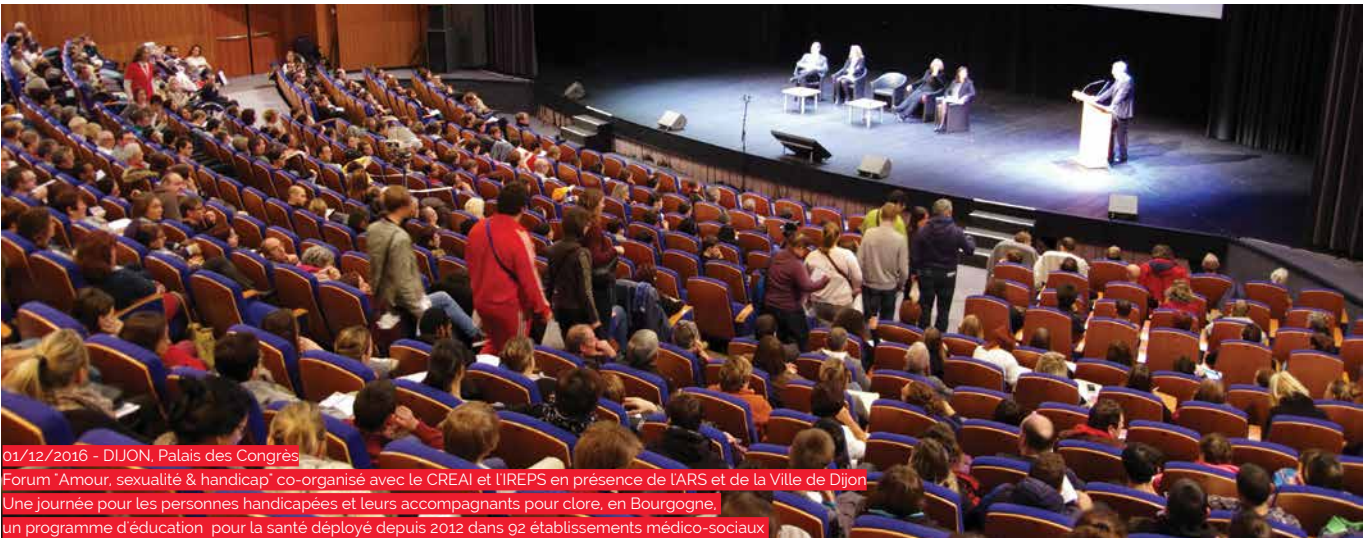
01/12/2016 - DIJON, Palais des Congrès Forum "Amour, sexualité & handicap" co-organisé avec le CREAI et l'IREPS en présence de l'ARS et de la Ville de Dijon Une journée pour les personnes handicapées et leurs accompagnants pour clore, en Bourgogne, un programme d'éducation pour la santé déployé depuis 2012 dans 92 établissements médico-sociaux