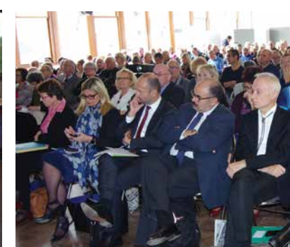
Dijon, 21/10/2016 : Interrégionale BFC/Grand Est "Mutualistes, vous avez la parole !"