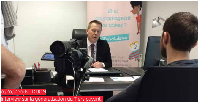
03/03/2016 - DIJON Interview sur la généralisation du Tiers payant.