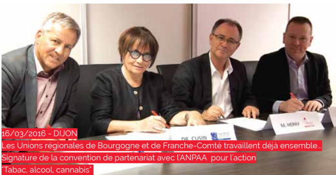
16/03/2016 - DIJON Les Unions régionales de Bourgogne et de Franche-Comté travaillent déjà ensemble... Signature de la convention de partenariat avec l'ANPAA, pour l'action "Tabac, alcool, cannabis"