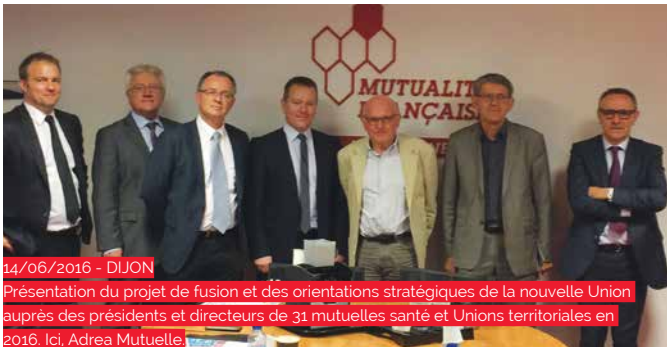
14/06/2016 - DIJON Présentation du projet de fusion et des orientations stratégiques de la nouvelle Union auprès des présidents et directeurs de 31 mutuelles santé et Unions territoriales en 2016. Ici, Adrea Mutuelle