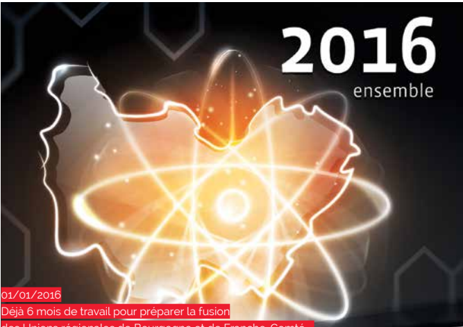
01/01/2016 Déjà 6 mois de travail pour préparer la fusion des Unions régionales de Bourgogne et de Franche-Comté... Plus que 6 !