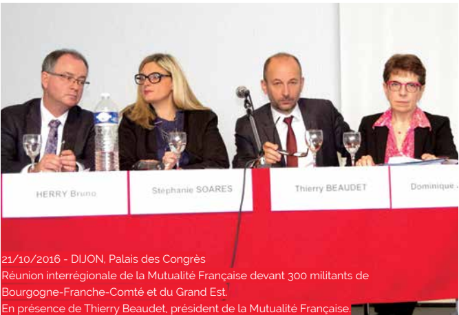
21/10/2016 - DIJON, Palais des Congrès Réunion interrégionale de la Mutualité Française devant 300 militants de Bourgogne-Franche-Comté et du Grand Est. En présence de Thierry Beaudet, président de la Mutualité Française