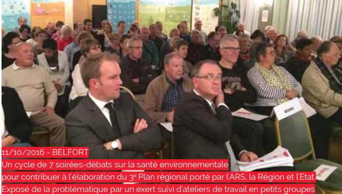
11/10/2016 - BELFORT Un cycle de 7 soirées-débats sur la santé environnementale pour contribuer à l'élaboration du 3 e Plan régional porté par l'ARS, la Région et l'Etat Exposé de la problématique par un expert suivi d'ateliers de travail en petits groupes