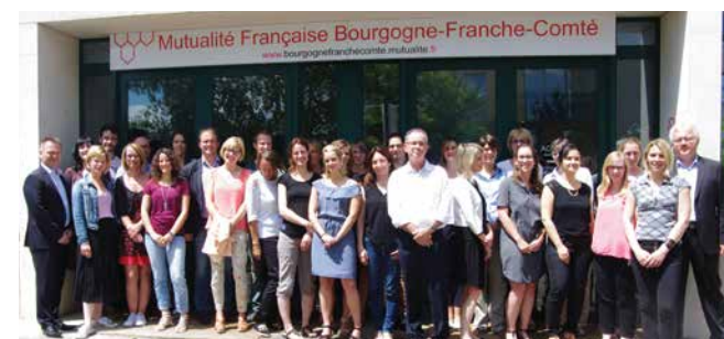
05/07/2016 - Au siège à Dijon, réunion des collaborateurs de la nouvelle Union régionale