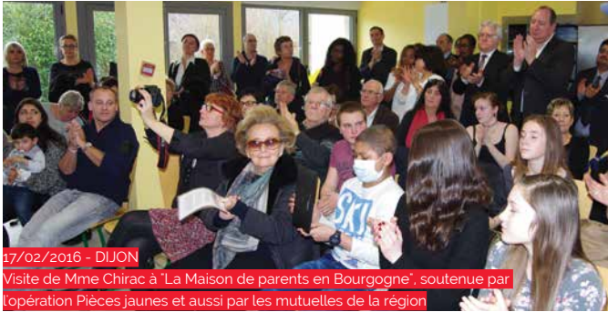
17/02/2016 - DIJON Visite de Mme Chirac à "La Maison de parents en Bourgogne", soutenue par l'opération Pièces jaunes et aussi par les mutuelles de la région