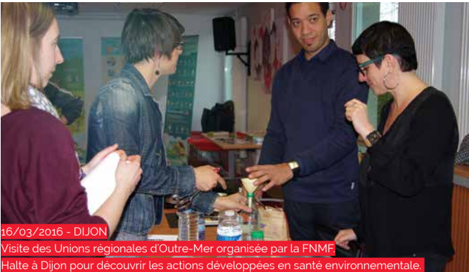
16/03/2016 - DIJON Visite des Unions régionales d'Outre-Mer organisée par la FNMF Halte à Dijon pour découvrir les actions développées en santé environnementale.