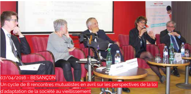
07/04/2016 - BESANÇON Un cycle de 8 rencontres mutualistes en avril sur les perspectives de la loi d'adaptation de la société au vieillissement