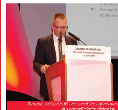
Beaune, 01/07/2016 : 3 assemblées générales et 1 conseil d'administration...