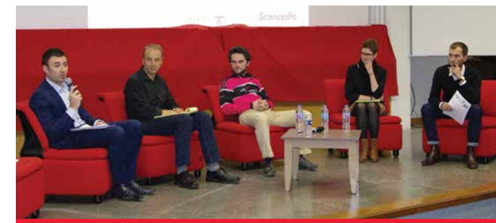
17/11/2016 - UFR Droit de Besançon - Conférence débat "L'entreprise du futur"

« Nous devons trouver la voie d'équilibre entre le tout-Etat et le tout-marché. Parce que je ne crois pas que l'Etat ait le monopole de la solidarité. »