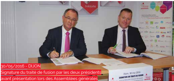
30/05/2016 - DIJON Signature du traité de fusion par les deux présidents avant présentation lors des Assemblées générales