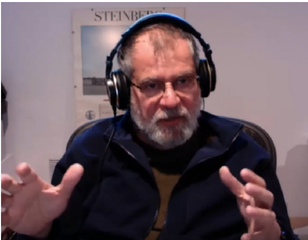
Martin Winckler lors du webinar « Santé des femmes : mythes ou réalités ? ». Il était en direct du Canada.

Dans le cadre de la démarche de coconstruction, un projet consacré à la santé des femmes a été créé pour la mutuelle MGEN Doubs. Cette dernière a été impliquée par les équipes du pôle Prévention Promotion de la Santé tout au long du processus d'ingénierie de projet. Ce travail s'est traduit par la mise en place de quatre interventions, jusqu'en 2022 :