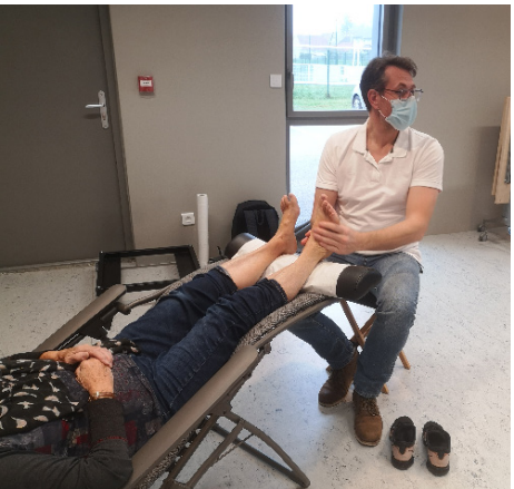
« Mes pieds, j’en prends soin » à Mirebeau-sur-Bèze (Côte-d’Or).

La Mutualité Française Bourgogne-Franche-Comté s’engage auprès des personnes de 60 ans et plus vivant à domicile à travers deux programmes. D’une part, « Les Ateliers Bons Jours » sont co-portés par l’Union régionale, la Carsat BFC, les MSA Bourgogne et Franche-Comté, et majoritairement financés par l’Agence régionale de santé. De nouvelles thématiques ont été ajoutées à ce programme, tout comme des ateliers en format digital afin de répondre aux nouvelles attentes des seniors. D’autre part, « Bien vieillir chez vous » est financé par les Conférences des financeurs de la prévention de la perte d’autonomie (CFPPA) dans les huit départements de la région. Grâce à ces deux programmes complémentaires, la Mutualité Française assure un maillage des territoires au plus près des bénéficiaires. Ainsi, elle agit également pour favoriser le lien social.