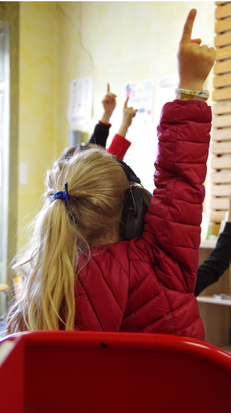
« Jeux de sons, jeux de signes » dans le Jura.