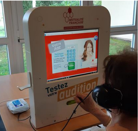
Les Atouts de l’âge à la résidence du Champ Saunier à Etang-sur-Arroux (Saône-et-Loire).

L’Union régionale met en œuvre des actions auprès des seniors en institution à travers deux programmes déployés dans la région : • « Les Atouts de l’âge en résidences autonomie », coordonné par le GIE Impa. • « Omegah » (Objectif mieux être grand âge hébergement), coordonné par le PGI et financé via des crédits médico-sociaux de l’ARS. Ce programme est développé depuis plus de 10 ans sur le territoire. Ce dernier a évolué en 2021, sous l’égide de l’ARS et des garants. Le Réseau des Maladies Neuro-Evolutives (Réséda) a été intégré comme nouvel opérateur. De nouvelles thématiques ont été ajoutées : « Bien-être et santé mentale », « Les alternatives non médicamenteuses » et « Les troubles psycho-comportementaux ». Les contenus et les formats des thématiques historiques ont, eux aussi, été améliorés afin de répondre à l’évolution des profils des résidents d’Ehpad et aux nouveaux référentiels.