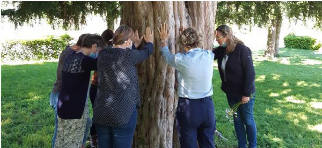
« Ma santé j'y travaille » à Buxy, en Saône-et-Loire.

86 actions sur devis 1 265 bénéficiaires