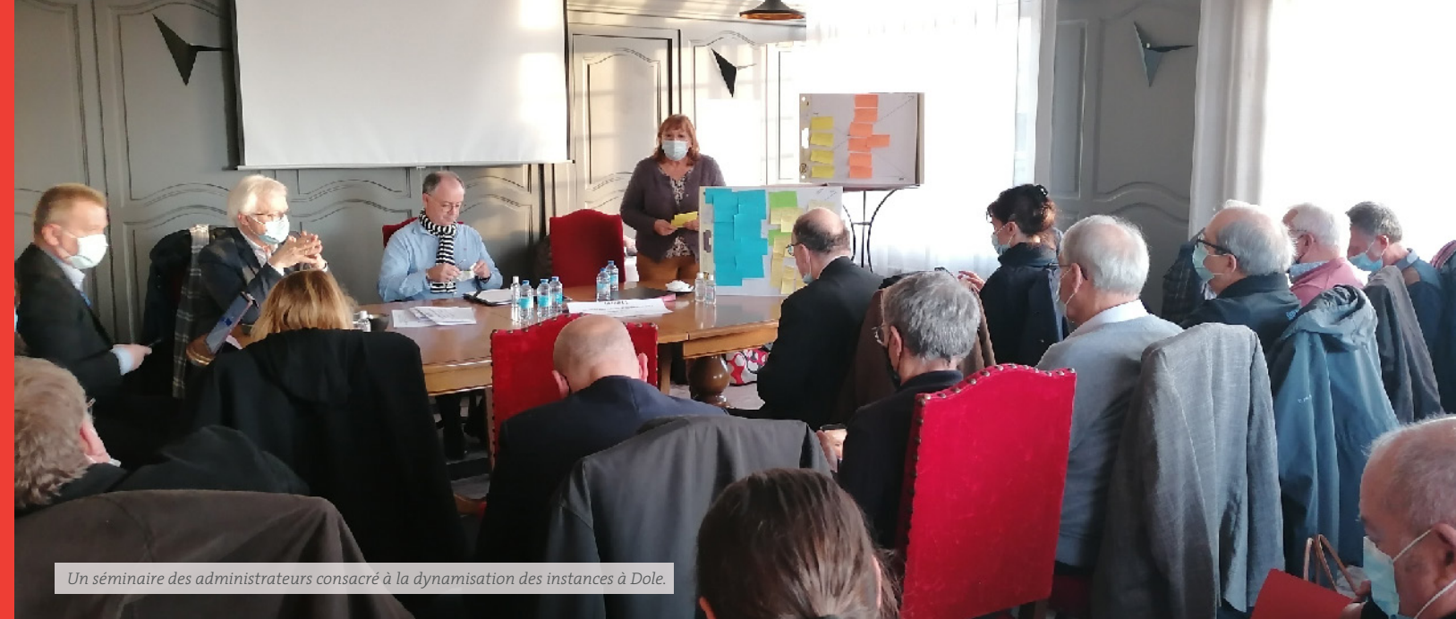
Un séminaire des administrateurs consacré à la dynamisation des instances à Dole.

Pour accompagner la défense du mouvement mutualiste, la Mutualité Française Bourgogne-Franche-Comté anime le réseau militant au plus près des territoires. L'action militante en 2021 a été largement marquée par la crise sanitaire. Si l'action terrain était moins présente, une réflexion en interne a été menée tout au long de l'année, notamment pour faire évoluer les instances mutualistes.