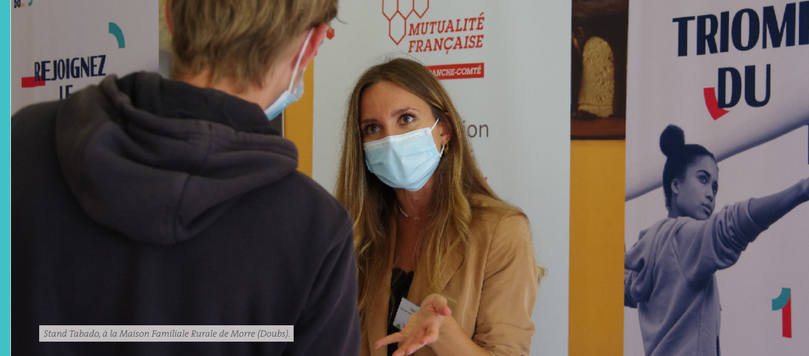
Stand Tabado, à la Maison Familiale Rurale de Morre (Doubs).

Acteur global de santé, la Mutualité Française Bourgogne-Franche-Comté est aussi experte en prévention et promotion de la santé. Elle conçoit des actions concrètes et les déploie dans les territoires, en réponse aux priorités de santé publique. L'objectif est d'améliorer la santé et la qualité de vie des Bourguignons-Francis-Comtois.