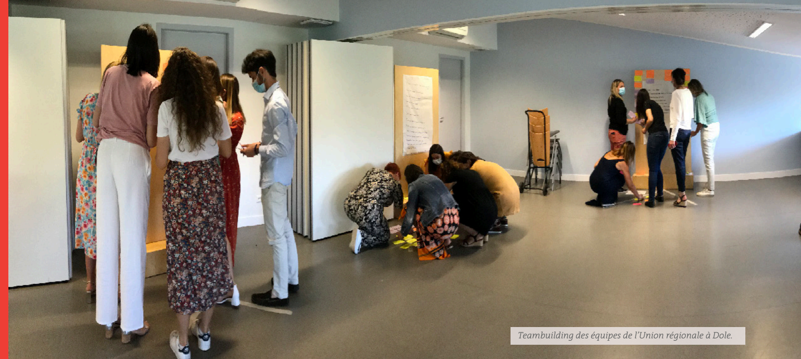
Teambuilding des équipes de l'Union régionale à Dole.

La Mutualité Française Bourgogne-Franche-Comté est une Union régionale de la Mutualité Française régie par le code de la Mutualité. Société de personnes à but non lucratif, elle représente la Fédération nationale sur la région. Elle promeut des protections sociales durables et une conception globale de la santé.