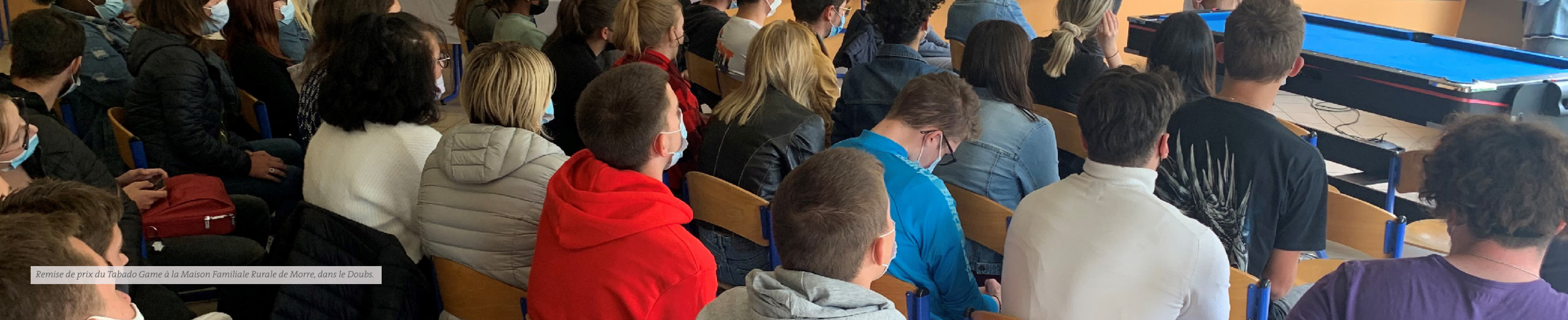
Remise de prix du Tabado Game à la Maison Familiale Rurale de Morre, dans le Doubs.