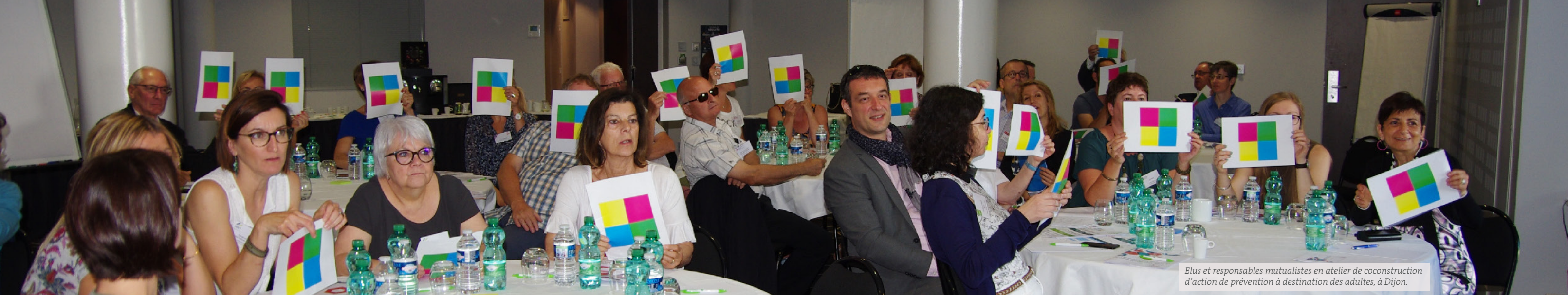
Elus et responsables mutualistes en atelier de coconstruction d'action de prévention à destination des adultes, à Dijon.