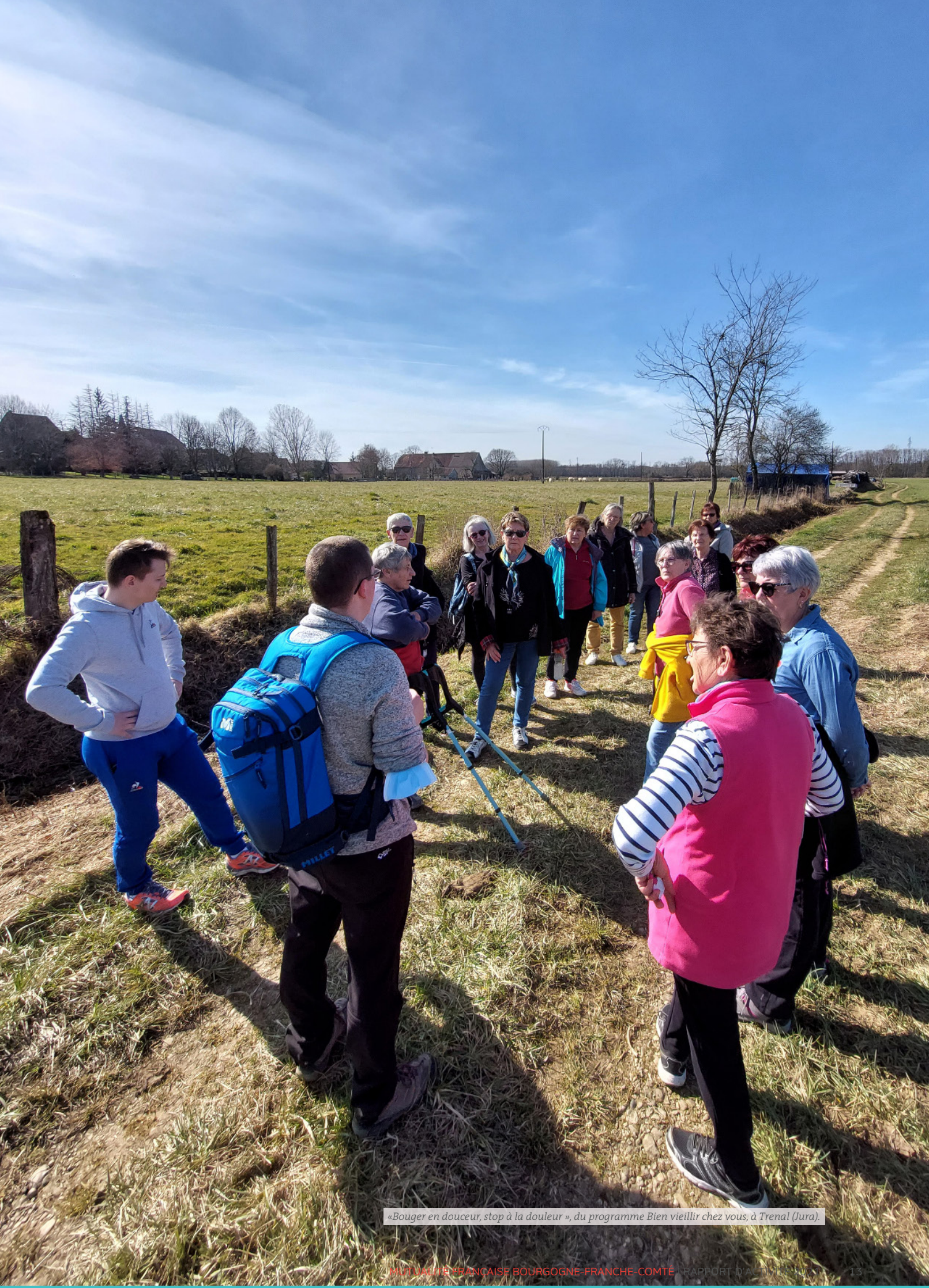
«Bouger en douceur, stop à la douleur », du programme Bien vieillir chez vous, à Trenal (Jura).

CHATBOT MICA 1 464 conversations 24 interventions