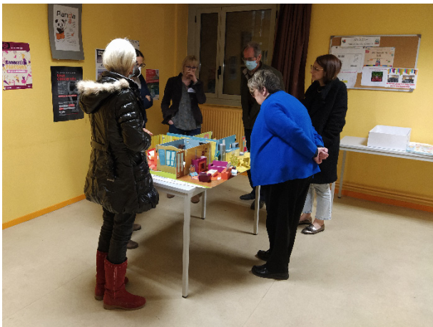
Un atelier consacré aux perturbateurs endocriniens.

Comme pour ses autres programmes, la Mutualité Française Bourgogne-Franche-Comté a coconstruit un certain nombre de ses actions avec d'autres préventeurs de la région. Par exemple, le projet expérimental « Ecrans en veille, enfants en éveil » financé par la Mildeca, a été entièrement conçu en partenariat avec l'Ireps BFC. Il vise à former les animateurs des accueils de loisirs sans hébergement (ALSH) au développement des compétences psychosociales.