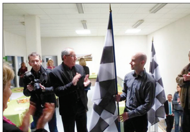
passage de relais BGE - MFQ

a fait le lien entre la « responsabilité sociétale et l'innovation sociale »